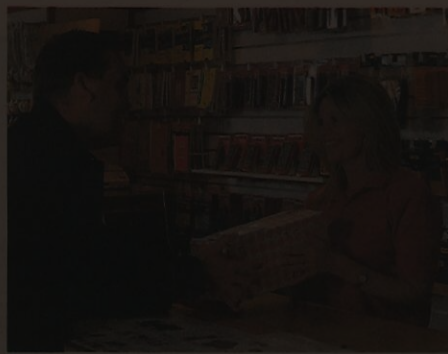
Tra i leader mondiali nella distribuzione di prodotti industriali

Trentadue sedi nel mondo. Oltre 160 distributori. Distribuzione di componenti industriali per ogni necessità h24. Oltre 60 anni di esperienza. 500.000 articoli. Un catalogo cartaceo in 32 versioni e 8 lingue. Un sito di e-commerce veloce, sicuro in 70 versioni e 17 lingue. Ecco alcuni numeri di RS Components, azienda nata in Inghilterra nel 1937 come Radiospares, oggi integrata nel gruppo multinazionale Electrocomponents. Oggi RS Components è la principale realtà mondiale nel settore della distribuzione a catalogo e web di prodotti industriali. La sede italiana di RS Components è presente a Cinisello Balsamo con il centro logistico a Vimodrone, in un sito industriale di oltre 10mila m2 che spicca per i più moderni e avanzati sistemi di distribuzione logistica sul mercato. RS Italia gestisce circa 80mila prodotti, evadendo oltre 1.500 ordini giornalieri per i 50mila clienti nazionali. Quanto alla sicurezza dei dipendenti dal 2009 il Gruppo ha introdotto la campagna di sensibilizzazione mondiale, "Target Zero", finalizzata alla riduzione degli infortuni seguita dalla promozione a cura della filiale italiana di una serie