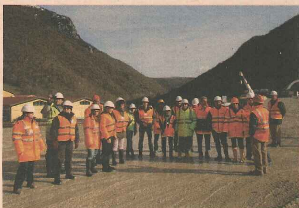
Personale Pegaso Group in cantiere

elementi indispensabili per il successo nell'interesse generale. Grazie a questo spirito e impegno, nel 2013 Pegaso Group ha ottenuto, prima in Italia tra le società di Ingegneria, il Rating di Legalità, attribuito dall'Autorità Garante della Concorrenza e del Mercato e l'attestato di Impresa Responsabile in materia di Responsabilità Sociale d'Impresa rilasciato da Unioncamere e Regione Lombardia. Questi principi sono applicati nel sistema informativo Genesis, piattaforma progettata e sviluppata all'interno del grup-